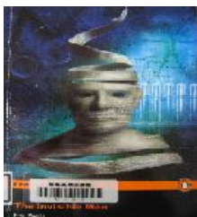
透明人間 The Invisible Man (1897)

自らが開発した薬品によって透明人間に変身した科学者。悪意憎しみに満ちた男がその能力を持って暴れ出した時人々は見えない恐怖に怯える—この物語は狂気の科学者と社会との対立を描く傑作として、SF小説の社会的意義にも触れた作品です。