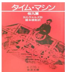
タイムマシン The Time Machine (1895)

ウェルズのSF作品は一八九〇年代から一九一〇代が中心です。二〇世紀に入ると自伝的要素の強い小説や女性解放を示唆する恋愛小説を発表しました。さらに、社会的政治的思想のメッセージ性の強い、例えば、合成食品による生物の「巨大化」を描いた作品や、第一次世界大戦の前に「原子力兵器の出現」と「核戦争の到来」を書いた作品を手がけました。生涯における文学、科学、社会、歴史、政治など、様々な分野の膨大な著作の中、触れなかったテーマは皆無といえる程です。社会活動家としてのウェルズは、国際連盟の樹立を提唱したり、人権宣言についての書簡をルーズヴェルトや「タイムズ」紙に送り（一九三九）日本国憲法の原案作成に影響を与えたともいわれています。「SFの父」といわれウェルズ。彼の作品に登場する「タイムマシン」や人間を透明にする化学物質、他の惑星からの「地球侵略」、人間の神経中枢エネルギーを飛躍的に増加させ時間を引き延ばす「新加速剤」…全てみな仮説です。彼は大衆の心の超自然的願望に科学的、倫理的、現代的説明をし、新しい小説ジャンルを生み出しました。SF史上最初で最大のアイデア・メーカーであったウェルズの作品は古典となりつつ、今なお、映画や新たなSF作品となって楽しませ続けています。