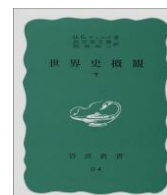
世界史概観 A Short History of the World (1922)

後半生においてウェルズは世界平和を願い、国家主義を排した普遍的な世界史叙述に取り組みました。第一次大戦を経て、更なる大戦争へ向う前に執筆された本書は地球と生命の誕生に始まる人種の歩みを白人文明中心思想を脱却した大きな視点で物語っています。